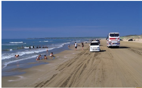
千里浜なぎさドライブウェイ(羽咋市)