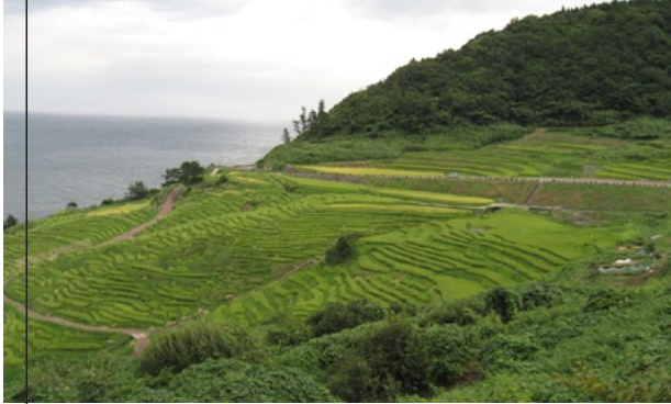
白米千枚田(輪島市)

能登半島の先端に位置し、風光明媚な海岸線が続く珠洲市と、伝統工芸の輪島塗や毎朝大勢の人で賑わう朝市などで知られる輪島市。温泉を引く宿も多い。