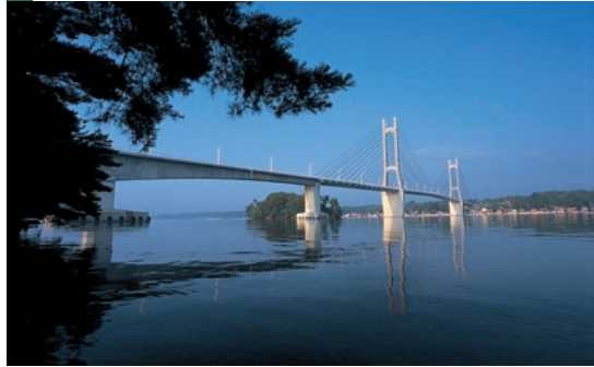
ツインブリッジのと(七尾市)

古来、能登の中心として栄えてきた港町。加賀藩の祖・前田利家が初めて一国を治めた土地でもある。一本杉通りなどで七尾の歴史・文化にふれることができる。